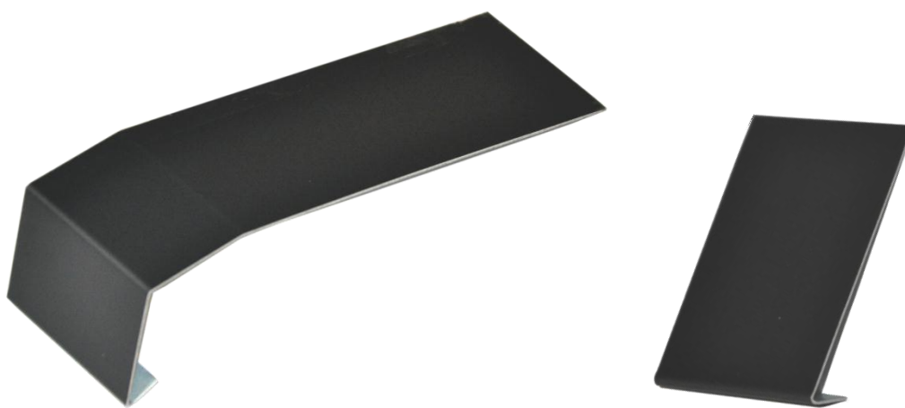
Maskownica górna (3P+M-MPg)